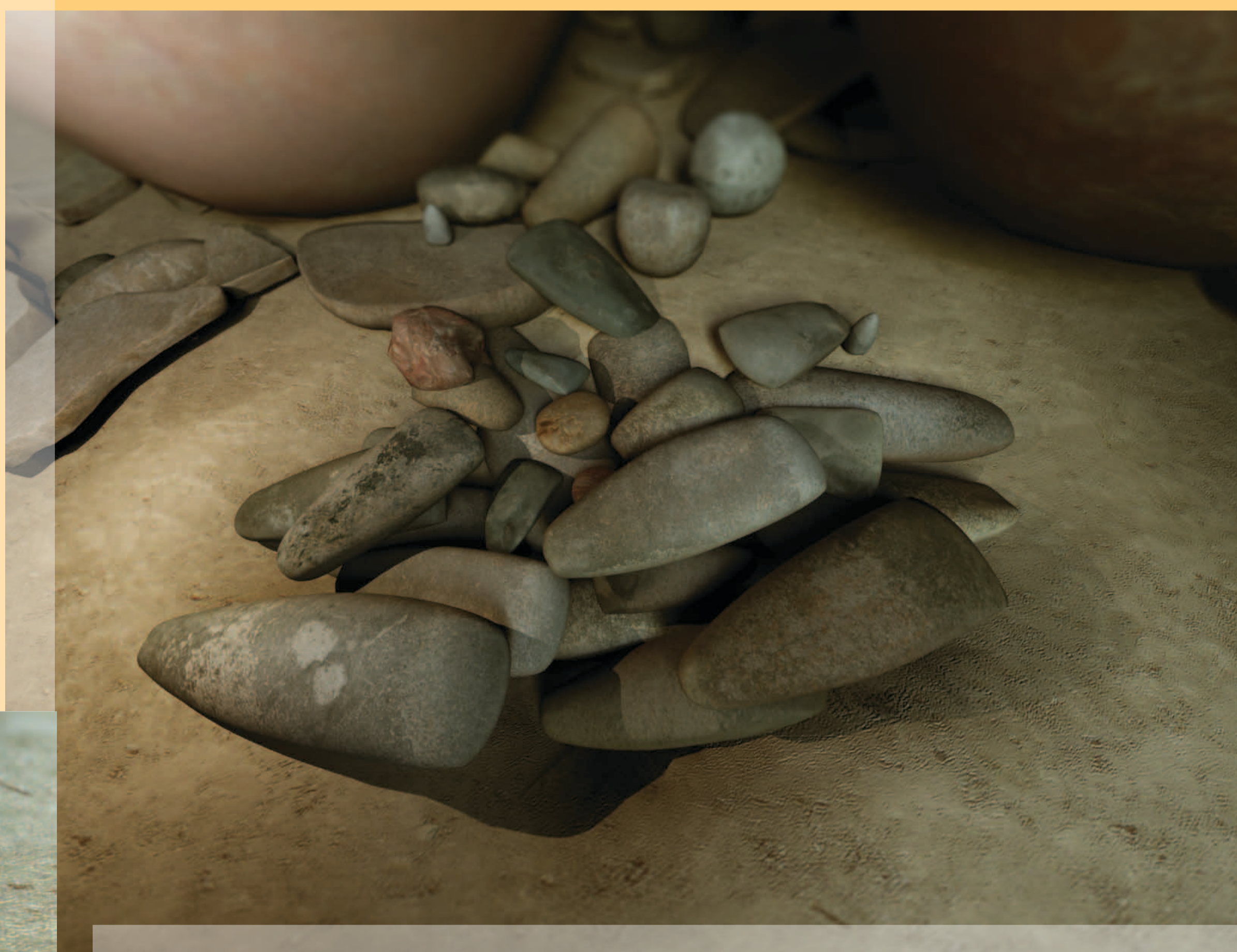
A cache of ground stone axes and adzes and other tools. Πέλεκεις, αξίνες και άλλα λίθινα εργαλεία εναποθεθειμένα σε κρύπτη.