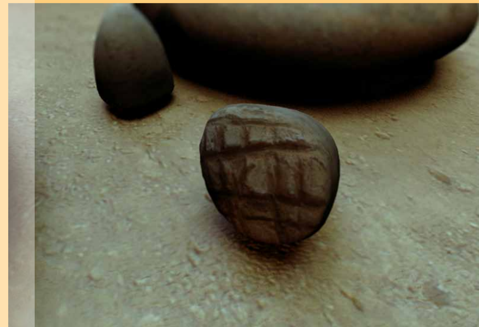
▲ An engraved conical stone perhaps used as a stamp seal. Κωνική πέτρα με εγχάραξη, η οποία ίσως να χρησίμευε ως σφραγίδα.