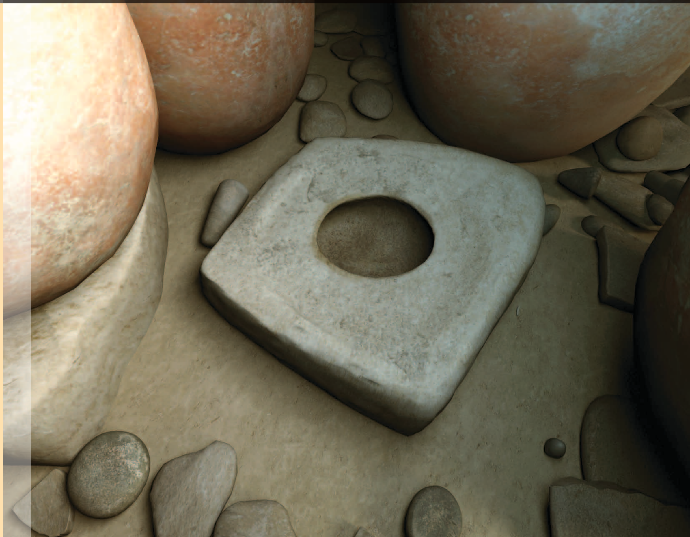
▲ A hollow stone probably used as an olive oil press, and later as a pot stand. Πέτρα με κοιλότητα η οποία πιθανότατα χρησιμοποιήθηκε ως πιεστήριο ελιάς για την παραγωγή ελαιόλαδου και αργότερα ως βάση για τη στερέωση αγγείου.

Other less obviously functional finds in the collapse from the house include rare and exotic blue faience beads, evidence for some of the earliest copper working on the island, large triton sea shells, and numbers of small stones shaped into cones. The function of these remains mysterious but they may have been tokens for exchange. One has a geometric design engraved into the base and it may have functioned as a stamp seal, suggesting a possible administrative or symbolic function. This is one of only two examples of this type known from the Late Chalcolithic. There is no doubt that the Pithos House was a building of a special nature, perhaps providing evidence for privileged access to resources by some sectors of society.