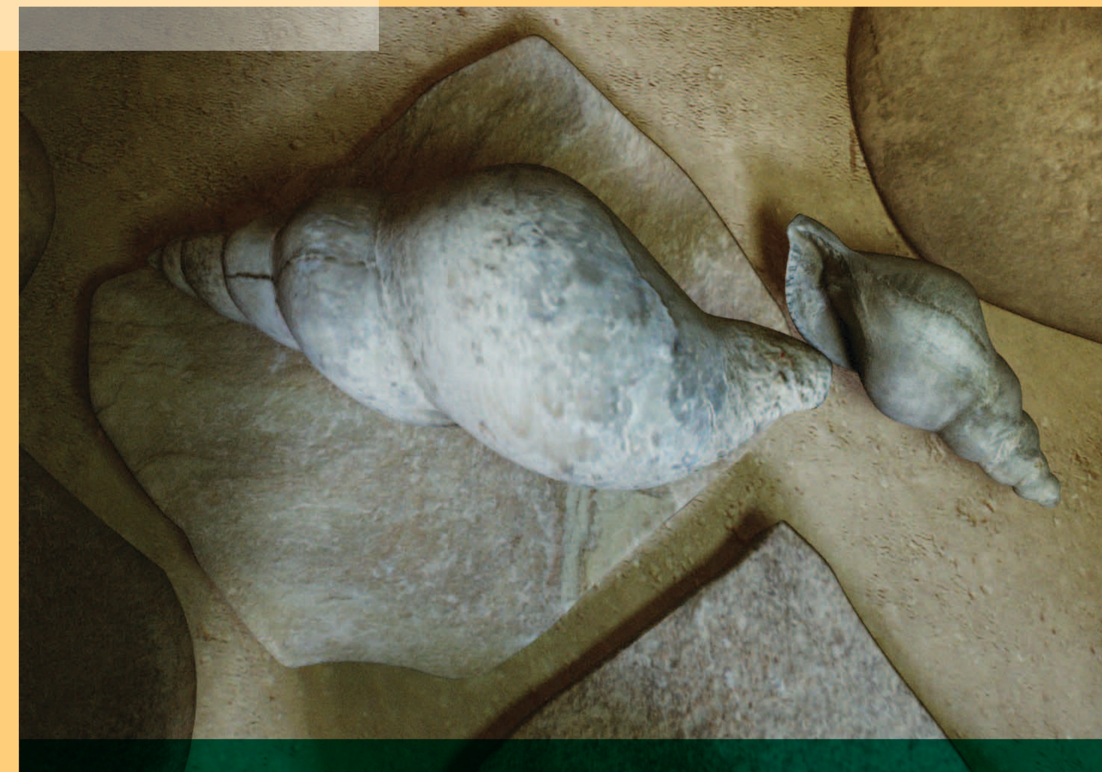
Triton shells found near the wall of the house. Κοχύλια τρίτωνες που βρέθηκαν κοντά στον τοίχο του σπιτιού.